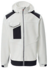
PERFORMER 2.0 ITEM CODE 001473-0053 COLOR CODE 00011