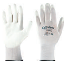
PU2001E ITEM CODE 001372-0181 COLOR CODE 00000