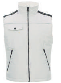
AIRSPACE 2.0 ITEM CODE 001029-0049 COLOR CODE 00000