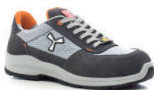
GET TEXFORCE LOW ITEM CODE 001481-0464 SUT COLOR CODE S1003