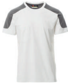
CORPORATE ITEM CODE 001464-0438 COLOR CODE 00029