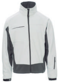
STORM ITEM CODE 000215-0053 COLOR CODE 00006