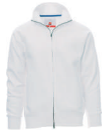
PANAMA+ ITEM CODE 000005-0001 COLOR CODE 00000