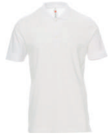
ROME ITEM CODE 001147-0373 COLOR CODE 00000