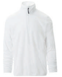
SOFT+ ITEM CODE 001294-0070 COLOR CODE 00000