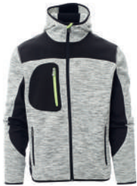
TRIP ITEM CODE 000453-0103 COLOR CODE 01021