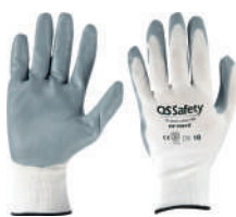
NF1001E ITEM CODE 001373-0297 COLOR CODE 00006