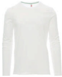
PINETA ITEM CODE 000893-0033 COLOR CODE 00000