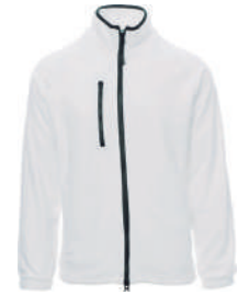
NORWAY ITEM CODE 000434-0069 COLOR CODE 00000