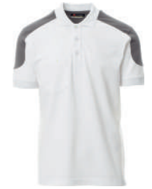
COMPANY ITEM CODE 001465-0440 COLOR CODE 00029