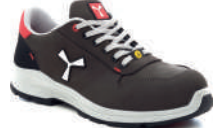
GET FORCE LOW ITEM CODE 001467-0414 NBK COLOR CODE S1001