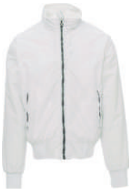
NORTH 2.0 ITEM CODE 001013-0343 COLOR CODE 00000