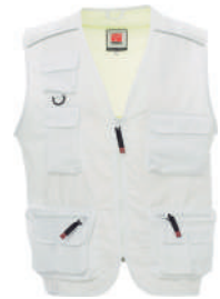
POCKET ITEM CODE 000187-0054 COLOR CODE 00000