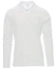
VERONA ITEM CODE 001213-0373 COLOR CODE 00000