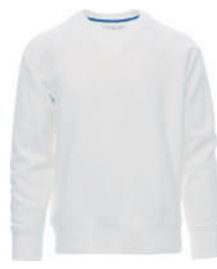
MISTRAL+ ITEM CODE 000004-0001 COLOR CODE 00000