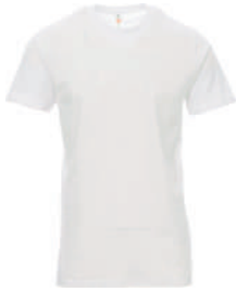
PRINT ITEM CODE 001048-0311 COLOR CODE 00000