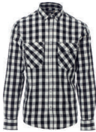
LABRADOR ITEM CODE 001355-0402 COLOR CODE 16002